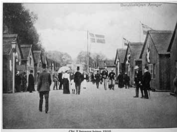
Chr. X besøger lejren 1910